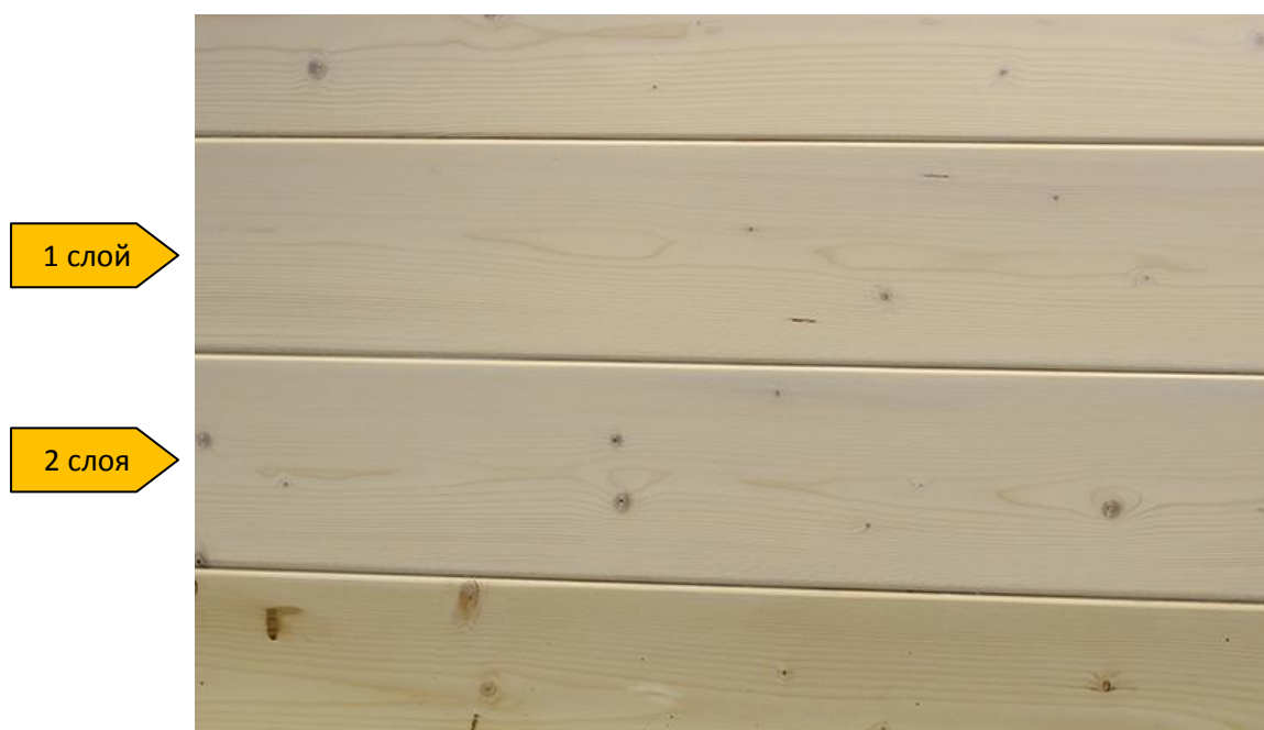
образцы с однослойным и двухслойным нанесением Woodwax

Adler Woodwax (арт.30720) можно применять в системе с Lignovit IG (арт53134). Оттенки Adler Woodwax см.на сайте www.adler-lacke.ru